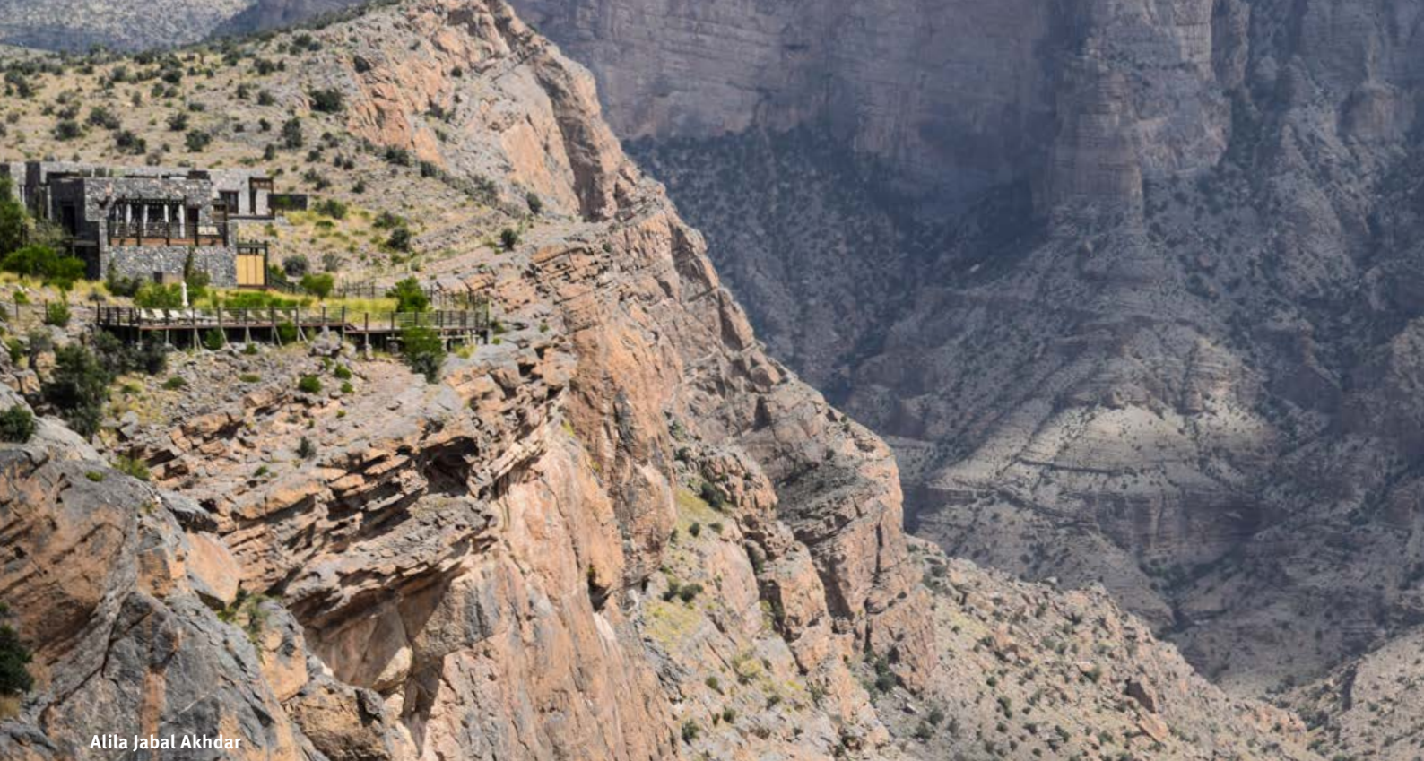
Alila Jabal Akhdar

exklusives Glamping Erlebnis inmitten der Wahiba Wüste!