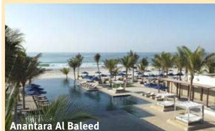
Anantara Al Baleed

In Salalah & Umgebung im Süden gibt es die schönsten Strände des Oman. Die Region wird auch ‚Karibik des Orients‘ genannt.