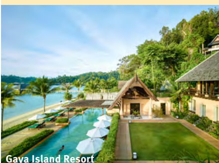
Gaya Island Resort

Runden Sie Ihre Erlebnisreise ab, indem Sie noch einige Tage am Strand verbringen: Der Shangri La Rasa Ria Resort befindet sich in der Nähe von Kota Kinabalu und ist für einen kurzen Aufenthalt ideal geeignet. Alternativ können Sie aber auch noch einige Tage auf der ruhigen Insel Gaya verbringen und die bunte Unterwasserwelt und denn feinen Sandstrand genießen.